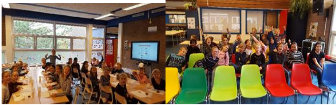
Groetjes groep 6B