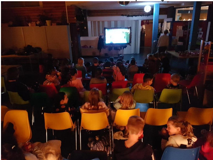
Indruk van de filmavond op De Dijck

Mijn dank nog aan de ouders die met hun kind over vuurwerk hebben gesproken. Deze week hebben wij er niet één keer mee te maken gehad. Alles wordt bewaard voor oudjaarsavond?